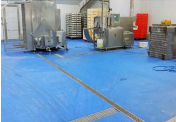
Sala de Elaboración y cocción con el revestimiento Ucrete DP10 en color azul.