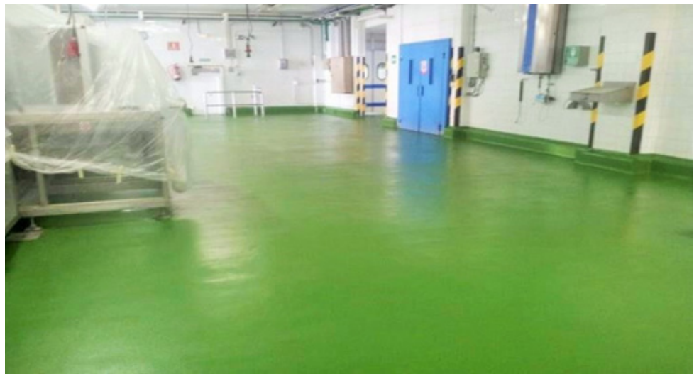
Sala de Elaboración y Envasado con el revestimiento Ucrete DP10 en color verde.