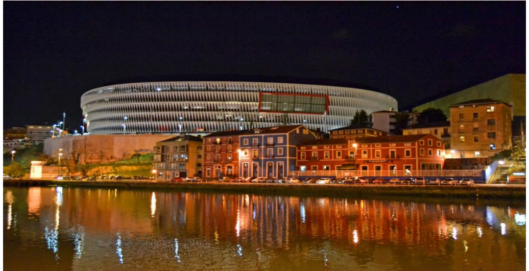
Vista del nuevo San Mamés