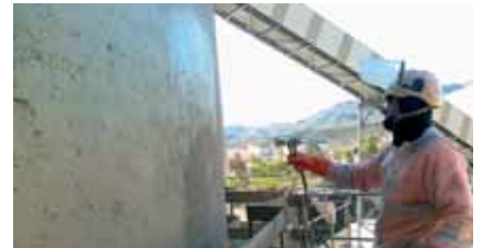
Aplicación del MasterProtect 320/325 EL por proyección con airless.