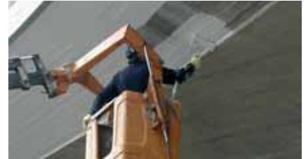
Aplicación del MasterProtect 320/325 EL con rodillo.