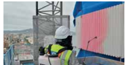
Aplicación del MasterProtect H 303 con sulfatadora.